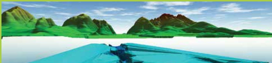
Despliegue de múltiples superficies en la visualización 3D

El visualizador 3D de Global Mapper permite cargar cualquier dato 3D, incluso nubes de punto 3D, modelos de elevación digital, elementos 3D, todos restituidos con estupendo realismo. La vista 3D oblicua generada a la medida ofrece una perspectiva verdaderamente realista y puede ser desplegada en la pantalla completa o al lado de la vista 2D. La captura 3D se hace para un archivo o por medio de grabación de vídeo de vuelos virtuales.